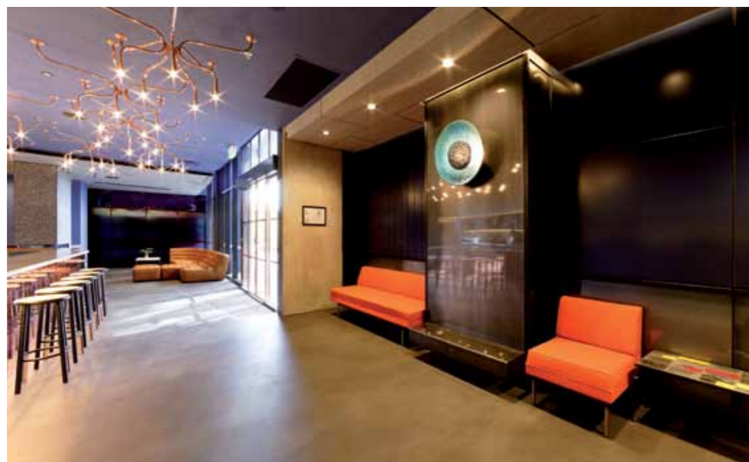
Objekt: Alpha Mosaic Hotel, Brisbane

Freedom in shape and colour: The architectural design is decisive for the room with PANDOMO. Monochrome surfaces, ornamental, slate and decorative designs are all equally possible.