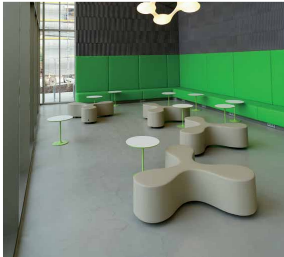
Objekt: Paracelsus Medizinische Privatuniversität (PMU), Salzburg

Choosing the right flooring is a hot topic in commercial areas which often see heavy traffic. A tough consistency and strong material is a prerequisite. PANDOMO Loft not only withstands permanent strain, but also makes each room special, with its unique characteristics.