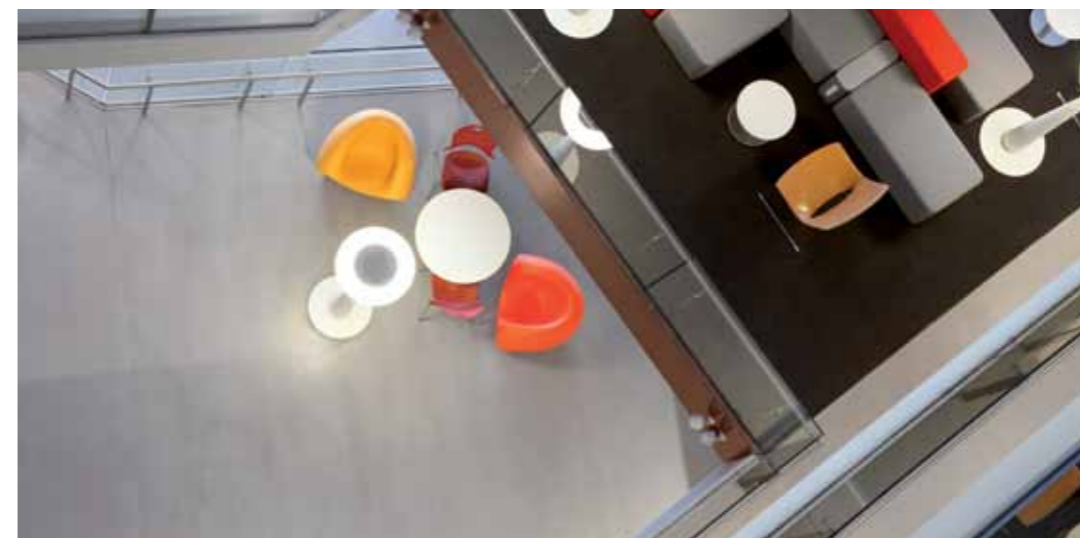
Objekt: Fakultät für Ingenieurwissenschaften und Informationstechnik - UTS Sydney

PANDOMO Floor also achieves maximum durability with minimal effort. Even at a thickness of 5 millimetres it is permanently resilient like high-quality parquet or soft natural stone. PANDOMO Floor surfaces are suitable for underfloor heating and chair castors and are resistant to colour fading. The basis for PANDOMO Floor is the designer levelling compound PANDOMO K1. Treating the floor with the specially formulated PANDOMO impregnating and sealing products ensures that it preserves its unique look whilst being perfectly protected against dirt and other external factors.