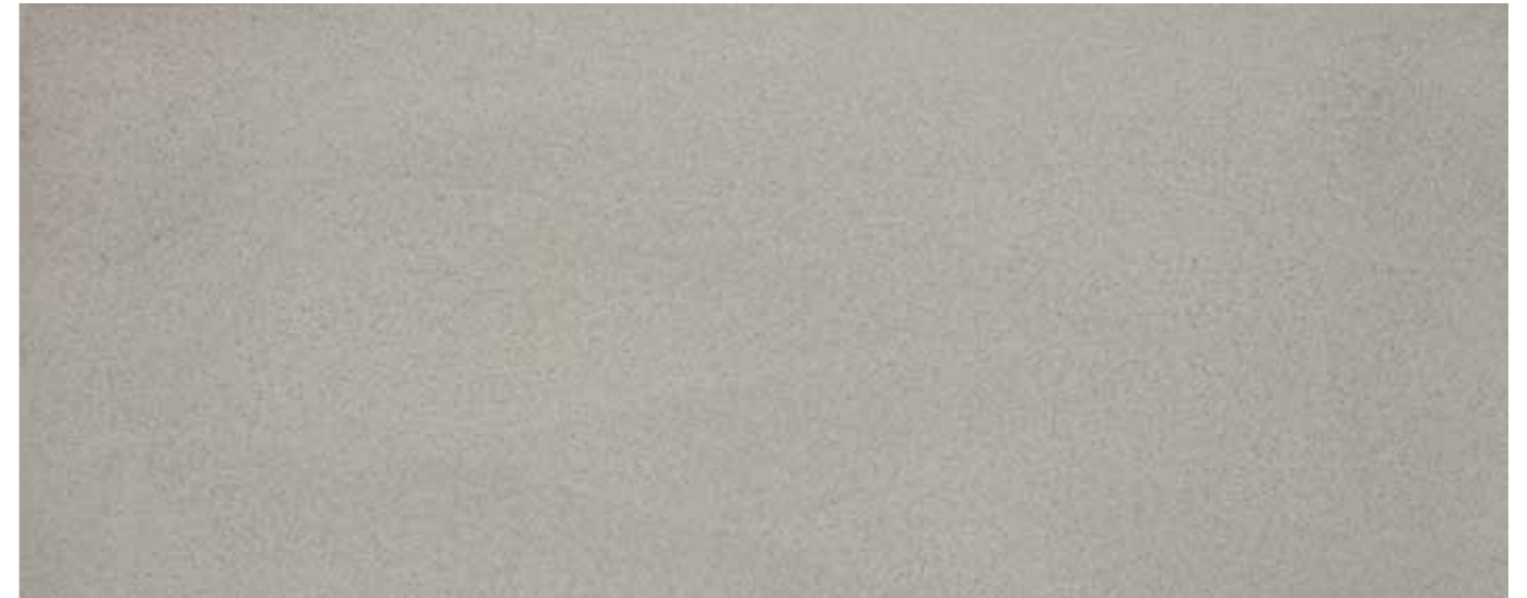
PANDOMO Floor Bodenfläche behandelt mit: PANDOMO SP-SL Steinöl, PANDOMO SP-F Porenfüller und PANDOMO SP-GS Seidenglanz-Siegel

Generally speaking, proper maintenance and cleaning are important for the service life of PANDOMO floors.