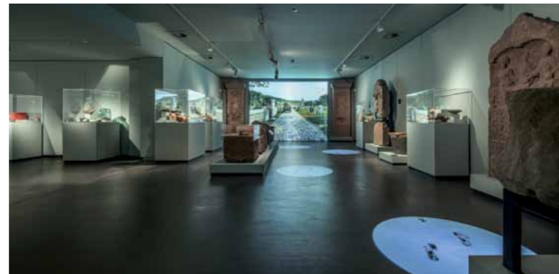
Objekt: „Raum Gräberfeld“ Kurpfälzisches Museum der Stadt Heidelberg Heidelberg