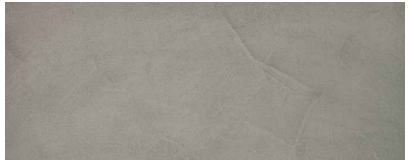
PANDOMO Loft Bodenfläche behandelt mit: PANDOMO SP-SL Steinöl, PANDOMO SP-F Porenfüller und PANDOMO SP-GS Seidenglanz-Siegel

PANDOMO Floor surface treated using: PANDOMO SP-SL stone oil, PANDOMO SP-F filler and PANDOMO SP-GS silky gloss sealer