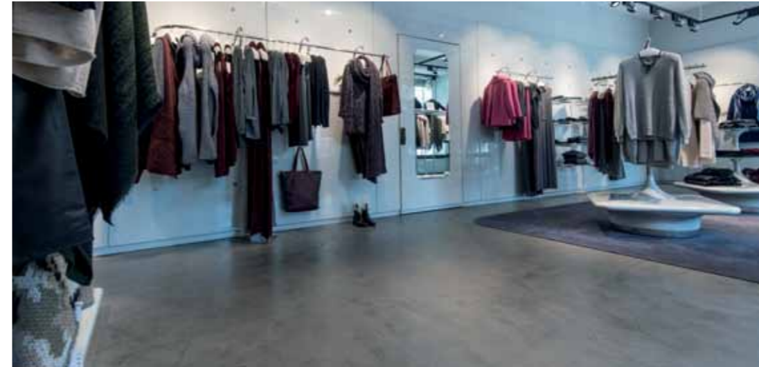
Objekt: Stefanel, Potsdam

It is here that the newest innovation in PANDOMO decorative fillers is able to prove its exceptional quality: e.g. the large-scale application of a mineral top layer can be applied thinly (approx. 2 mm) with PANDOMO Loft, meaning that the height adjustment of fixtures and doors becomes superfluous. In other words: PANDOMO Loft is not only beneficial visually, but also saves time in a distinctive manner.