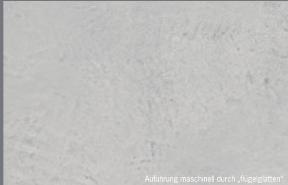
Auführung maschinell durch „flügelglätten“