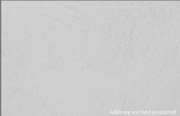
Auführung von Hand gespachtelt

Art der Verarbeitung gibt einen großen Spielraum für individuelle Oberflächen. Von homogen wolkig zu aufregend charakterstark. Auf den Bildern hier sind beispielhaft zwei unterschiedliche Verarbeitungsweisen zu sehen. Wir helfen Ihnen gerne bei der Wahl der passenden Optik.